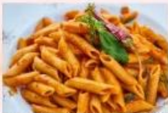
mit anschl. Mittagessen