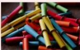
mit großer Tombola